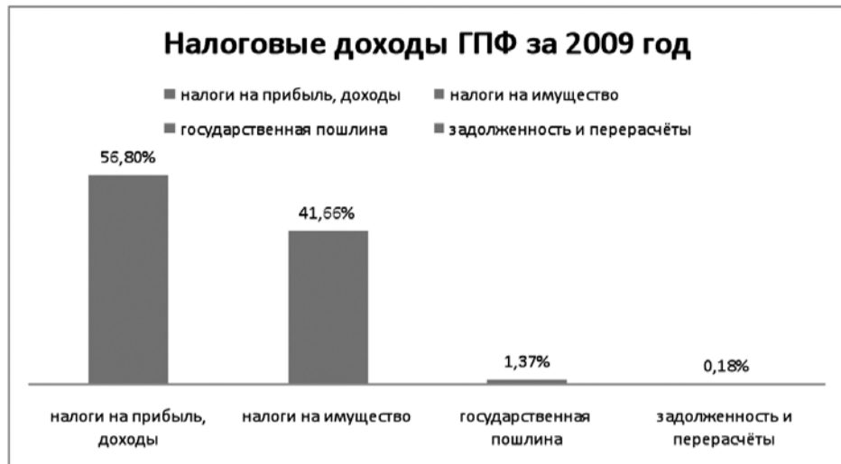
Диаграмма 2. Структура исполнения бюджета в разрезе налоговых доходов за 2009 год

Структура исполнения бюджета в разрезе налоговых доходов за 2009 год представлена на следующей диаграмме: