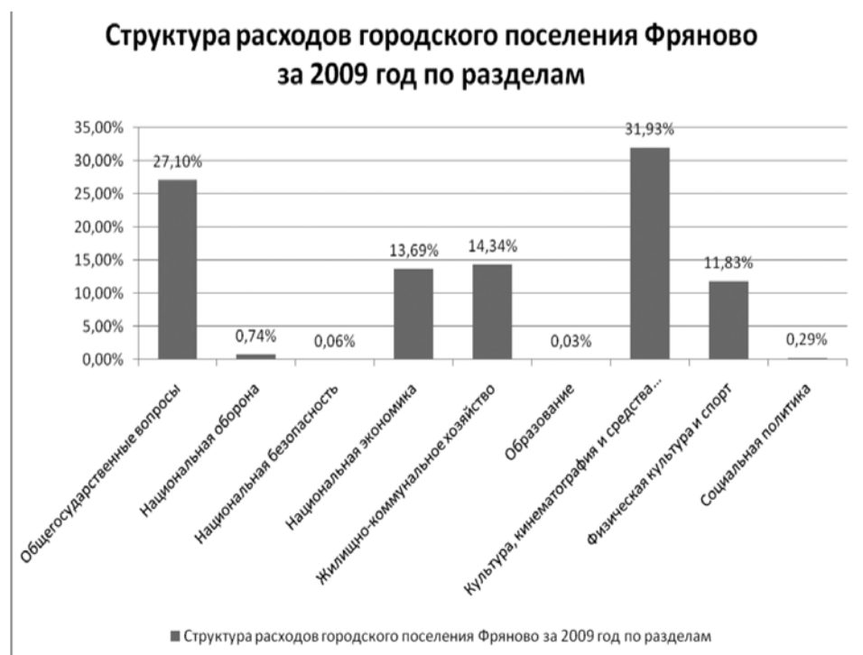
Диаграмма 4. Распределение расходов бюджета поселения за 2009 год.

Исполнение бюджета городского поселения Фряново за 2009 год по расходам составило 97,41% против 97,53% за 2007 год и 100,46% за 2008 год.